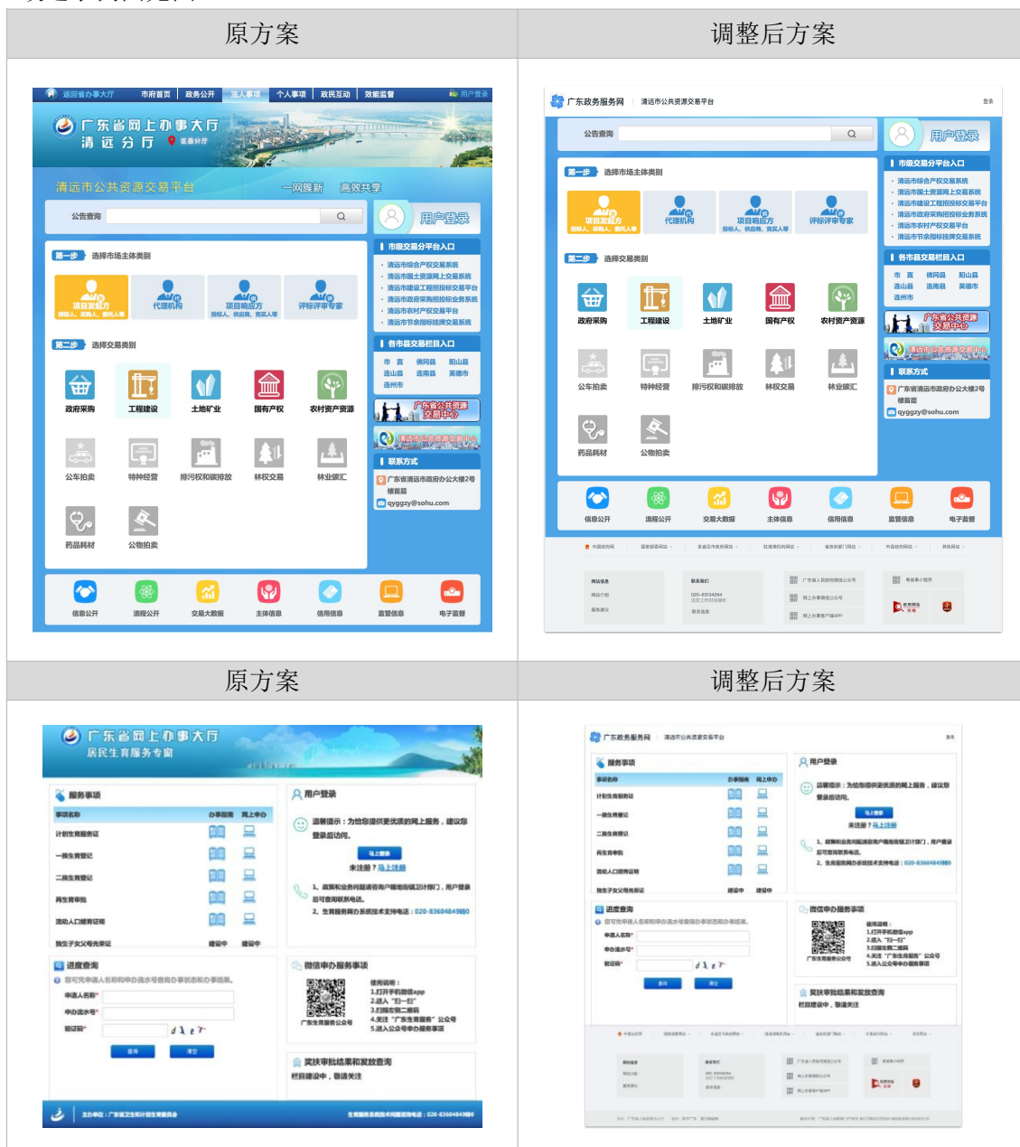
图 A.1 UI 改造示例图