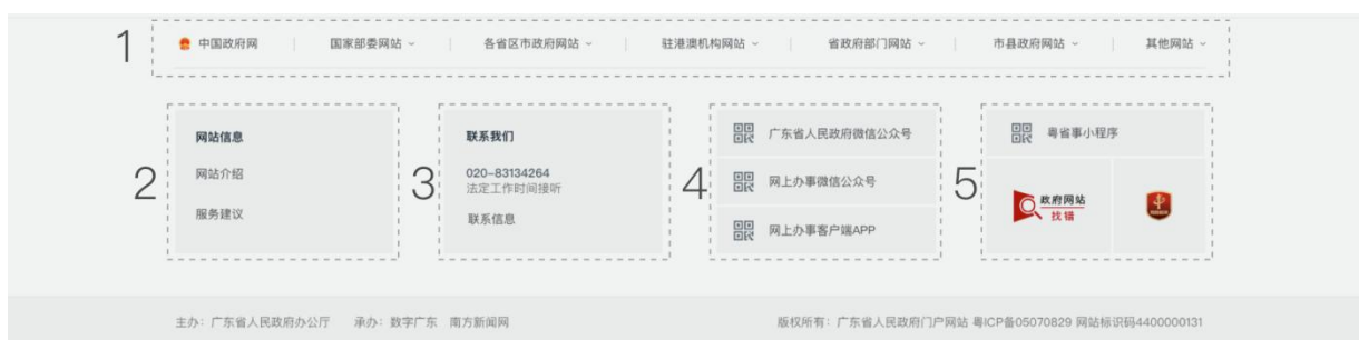
图 3 部件示意