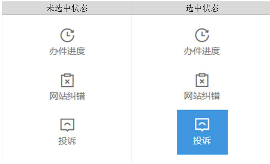
图 4 部件示意

侧边栏部件的格式有两种：未选中、选中状态，以下为侧边栏部件的示意图 4 与部件说明表 4。