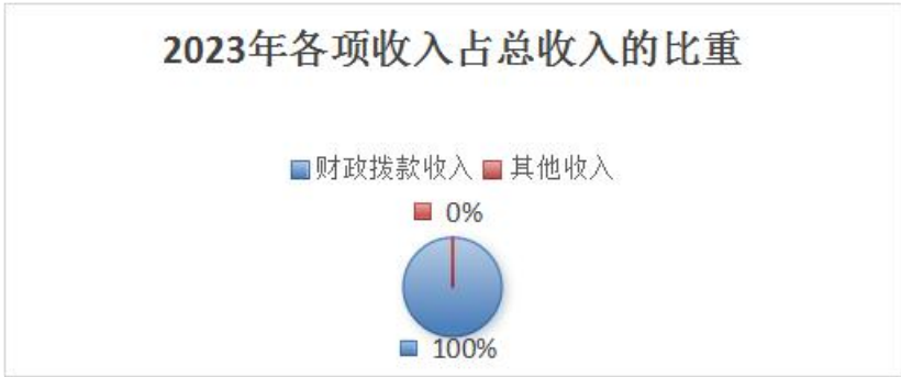
2023 年各项收入占总收入的比重

2023 年度中心支出总额 6,814.99 万元，①按支出性质来分：基本支出 3,267.93 万元，占总支出 47.95%，其中人员经费 3,074.71 万元，占总支出 45.12%，公用经费 193.22 万元，占总支出 2.83%；项目支出 3,547.06 万元，占总支出 52.05%。