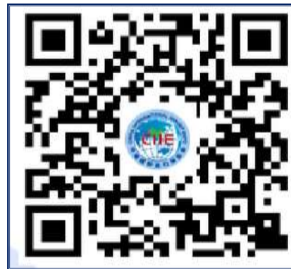
微信扫码 下载官方APP

可登录中国国际进口博览会官网-企业商业展-宣传资料-第六届境内专业观众报名指引视频观看操作指引。