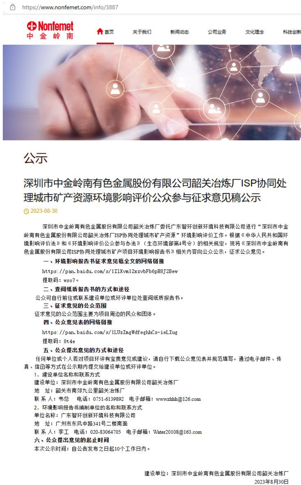
图 3.2-1 本项目征求意见稿网上公示截图

行量较大，为项目所在地公众易于接触的报纸。因此，载体选取的符合《环境影响评价公众参与办法》要求。