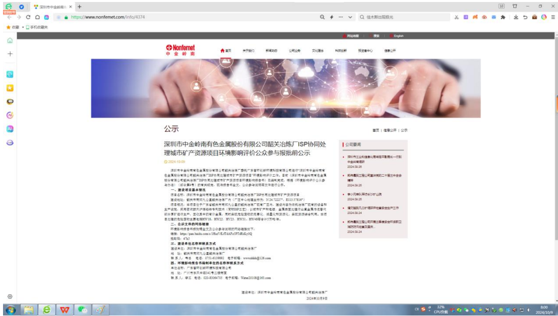
图 6.2-1 本项目报送前网上公示截图