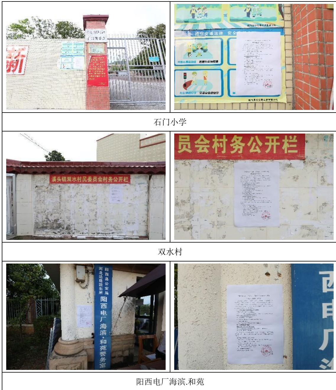
图 3.2-4 2022 年 10 月张贴公示相关图片