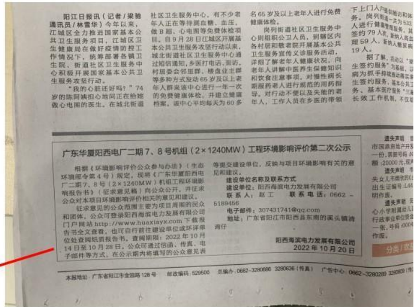
图 3.2-2 本项目征求意见稿登报公示照片（2022.10.20）