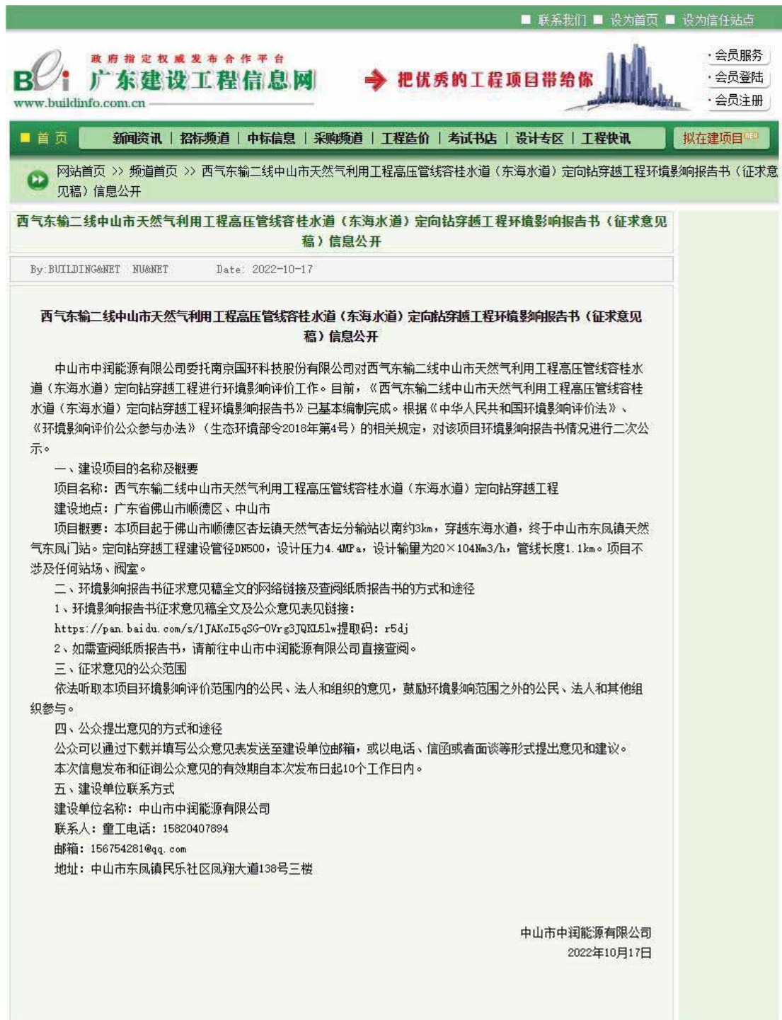
图 3-1 广东建设工程信息网公示截图