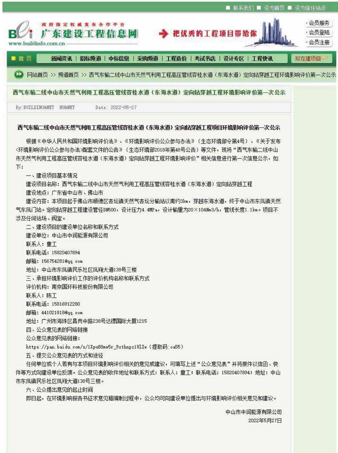
图 2-1 首次环境影响评价信息公开截图