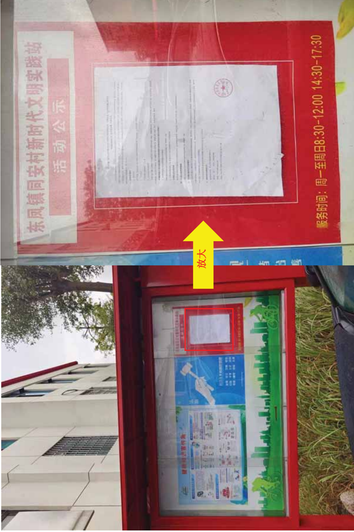
图 3-4 (a) 本项目现场公示张贴照片（中山市东风镇同安村）