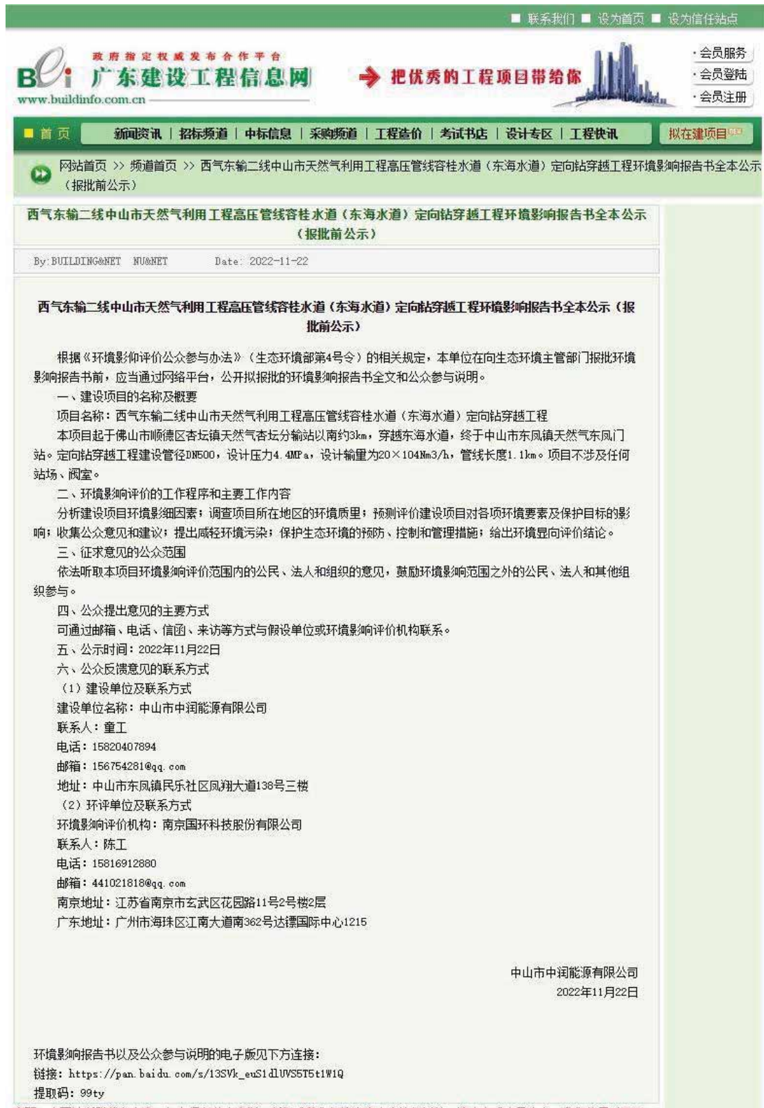
图 5-1 报批前网上公开截图