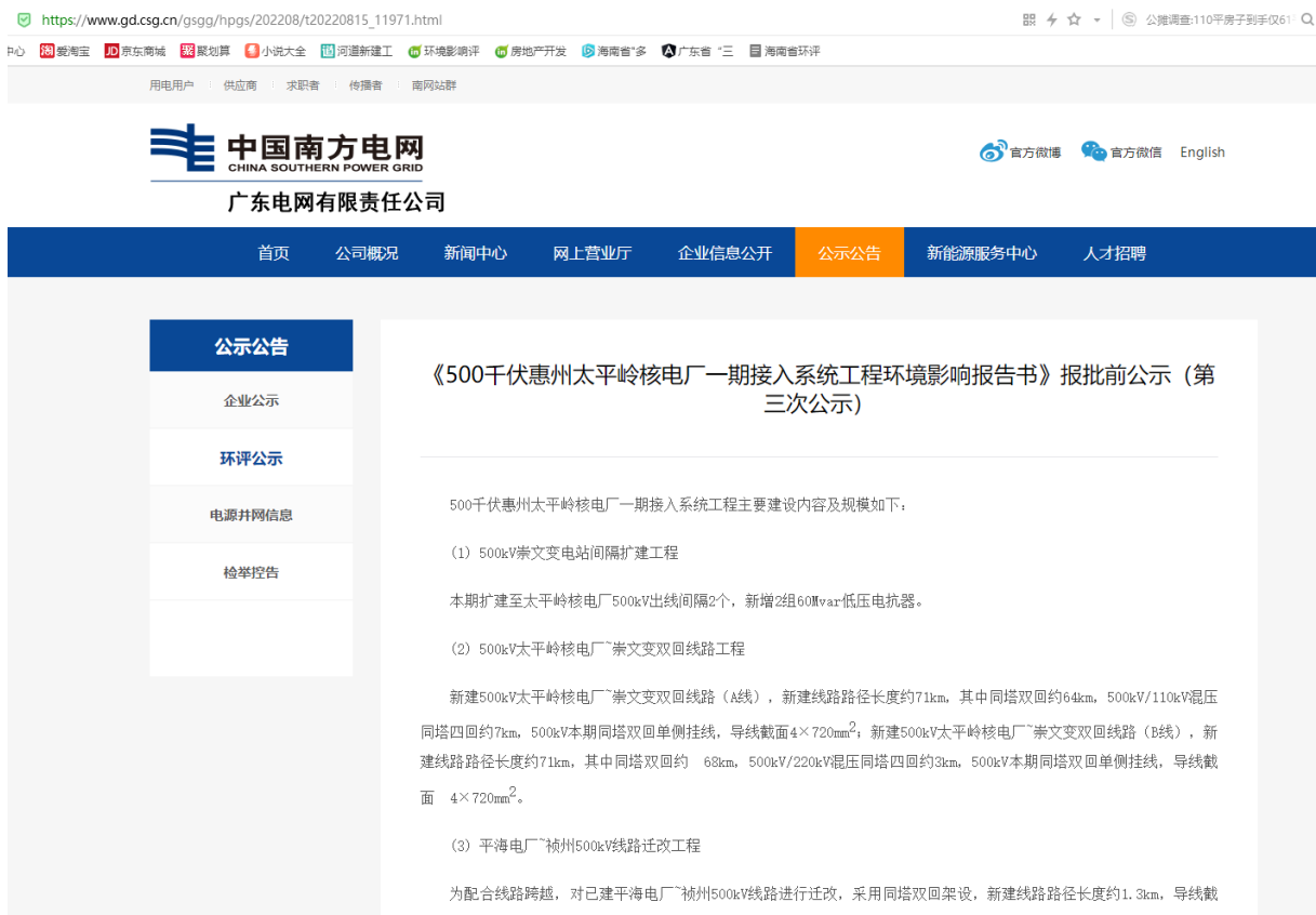
图 6.1-1 环境影响评价报批前网上公示附件

建设单位于2022年8月15日在广东电网有限责任公司网站 https://www.gd.csg.cn/gsgg/hpgs/202208/t20220815_11971.html 上进行了环境影响报告书报批前公示。