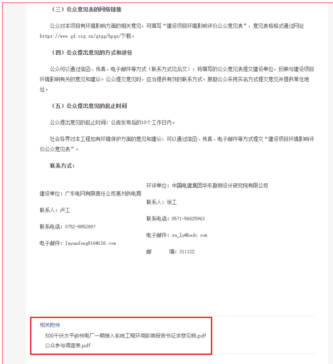
图 3.2-2 环境影响评价征求意见稿网上公示附件

网上公示通过建设单位网络平台公开，且持续时间不少于 10 个工作日，满足《环境影响评价公众参与办法》中关于征求意见稿公开的要求。