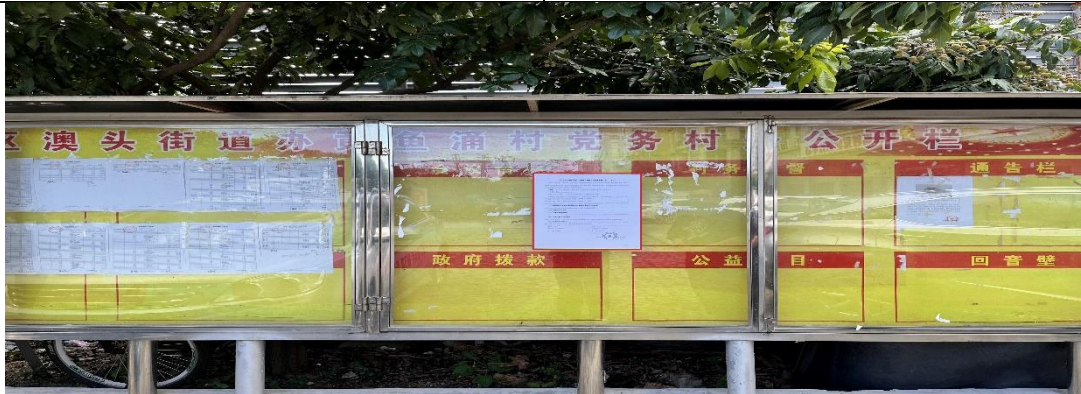
惠州市大亚湾区澳头街道黄鱼涌村委会