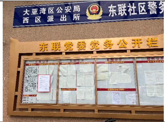
惠州市大亚湾区西区街道东联村