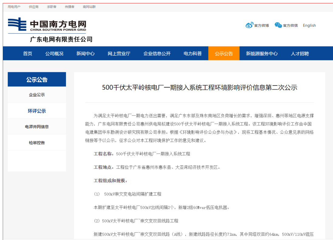
图 3.2-1 环境影响评价征求意见稿网上公示

建设单位于 2022 年 7 月 1 日在广东电网有限责任公司网站 https://www.gd.csg.cn/gsgg/hpgs/202207/t20220701_11906.html 上进行了环境影响报告书征求意见稿公示，并且在网站公示中附上了建设项目环境影响评价公众意见表及环境影响报告书（征求意见稿）全文。公开期限不少于 10 个工作日。