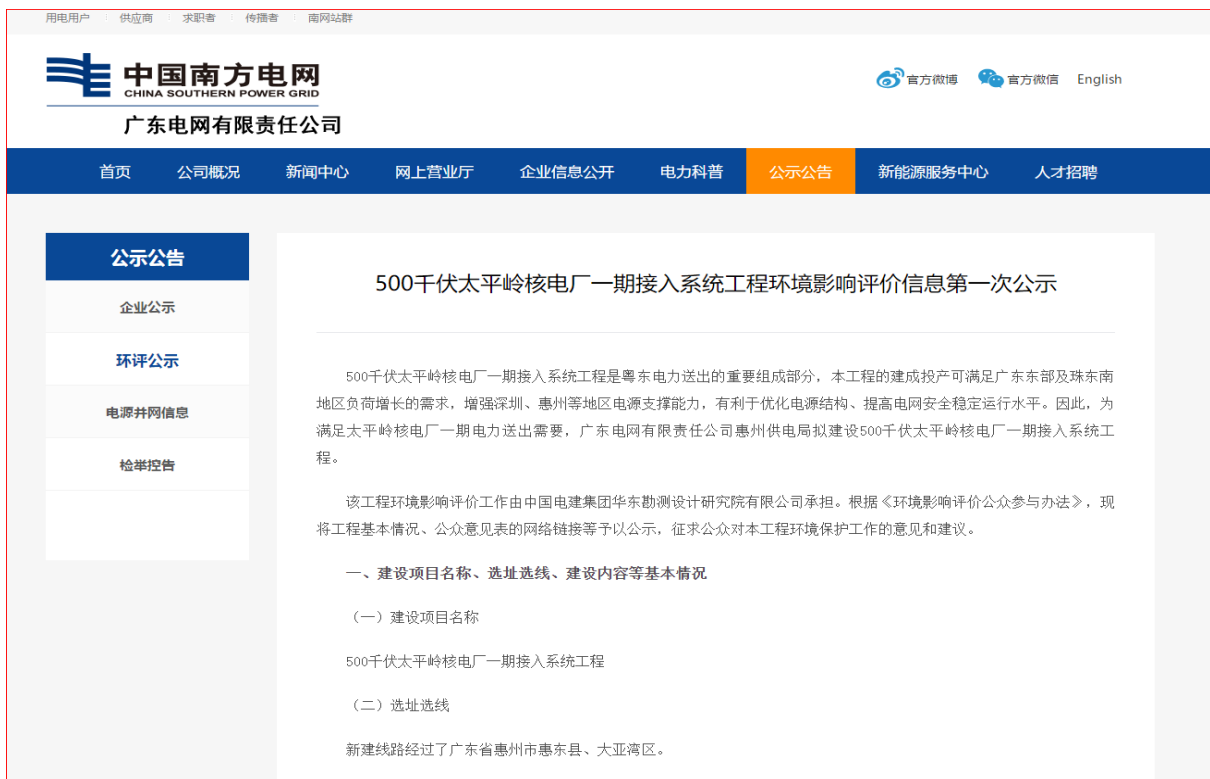
图 2.2-1 首次环境影响评价信息公开网络截图

建设单位于2022年5月7日起，在广东电网有限责任公司网站 https://www.gd.csg.cn/gsgg/hpgs/202205/t20220507_11712.html 进行首次环境影响评价信息公开，公示期限不少于10个工作日。