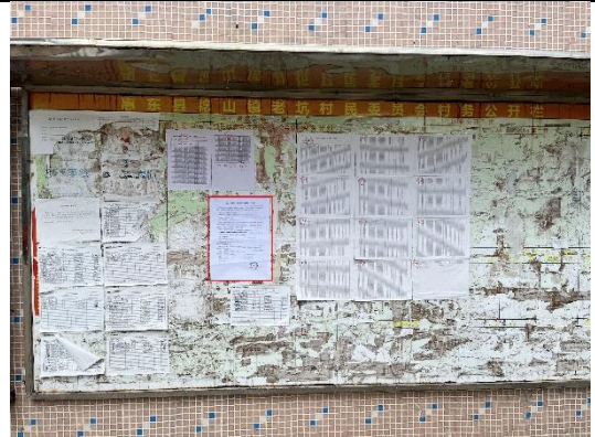
惠州市惠东县稔山镇老坑村委会