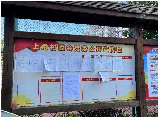
惠州市大亚湾区霞涌街道上角村委会