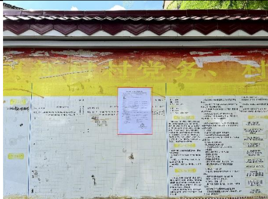
惠州市惠东县稔山镇新村村委会