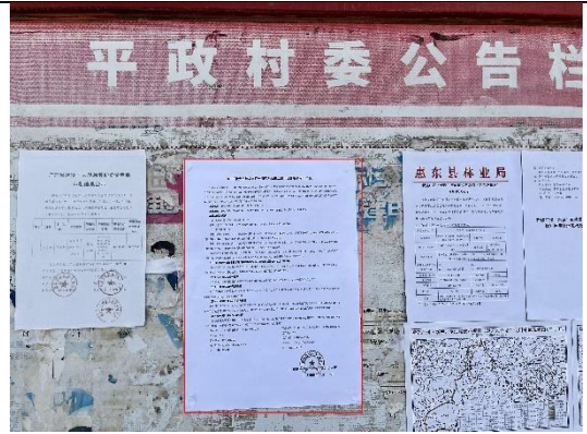
惠州市惠东县古隆镇平政村委会