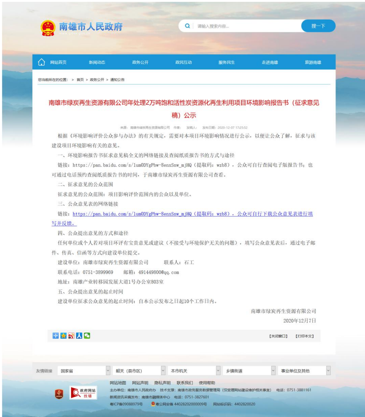
图 3.2-1 征求意见稿网上公示截图