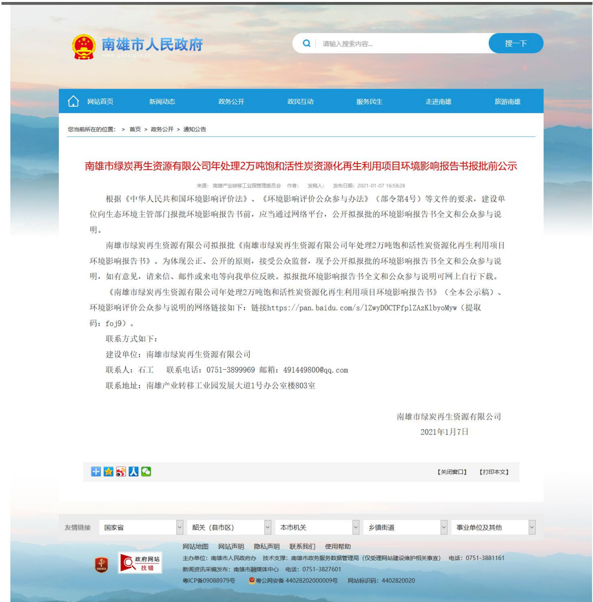
图 5.2-1 项目报批前网上公示截图