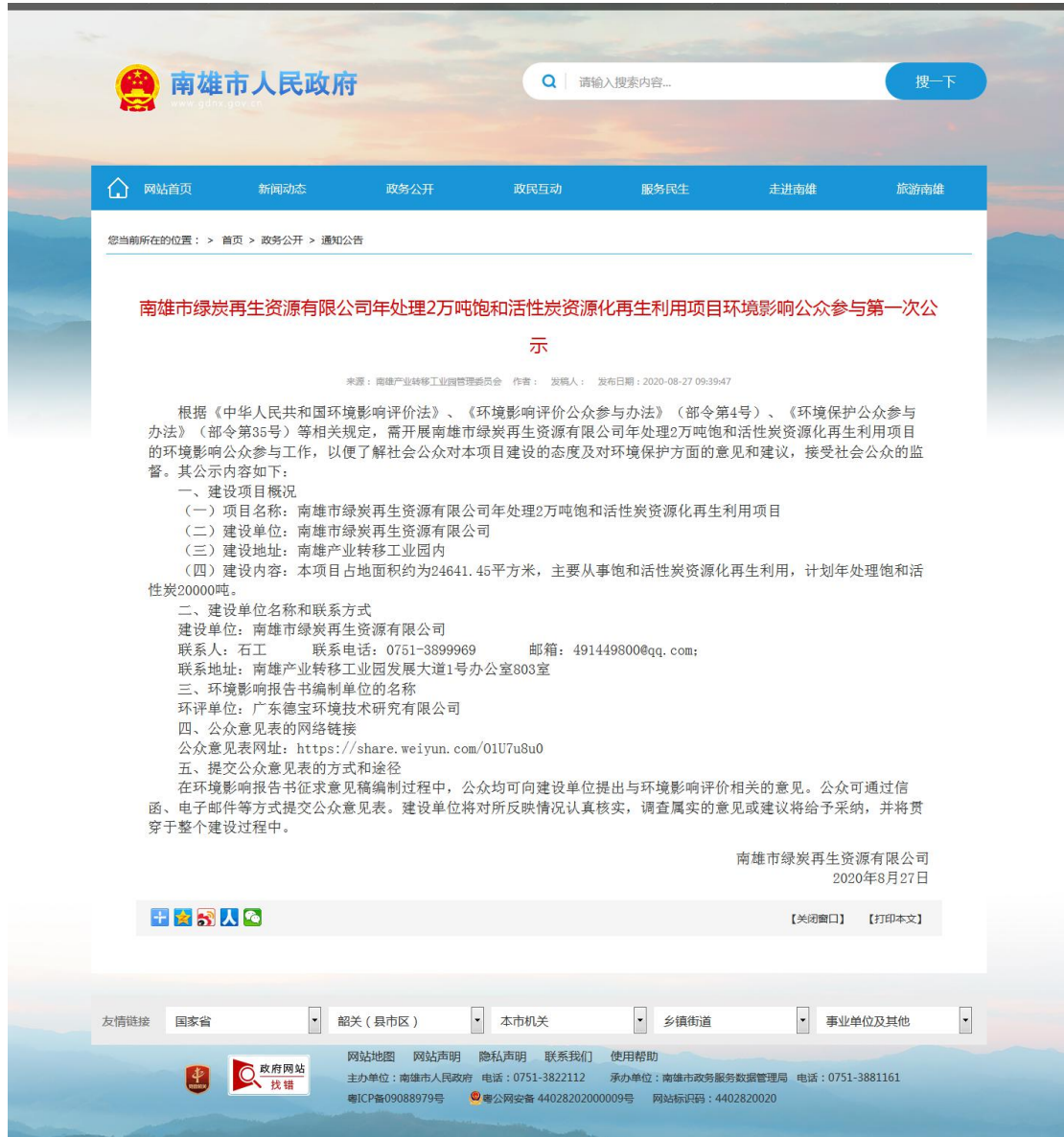
图 2.1-1 本项目首次环境影响评价信息公示截图