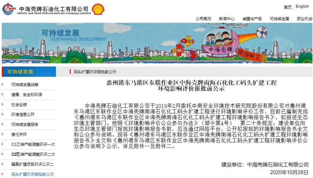
图 6-1 报批前公示截图