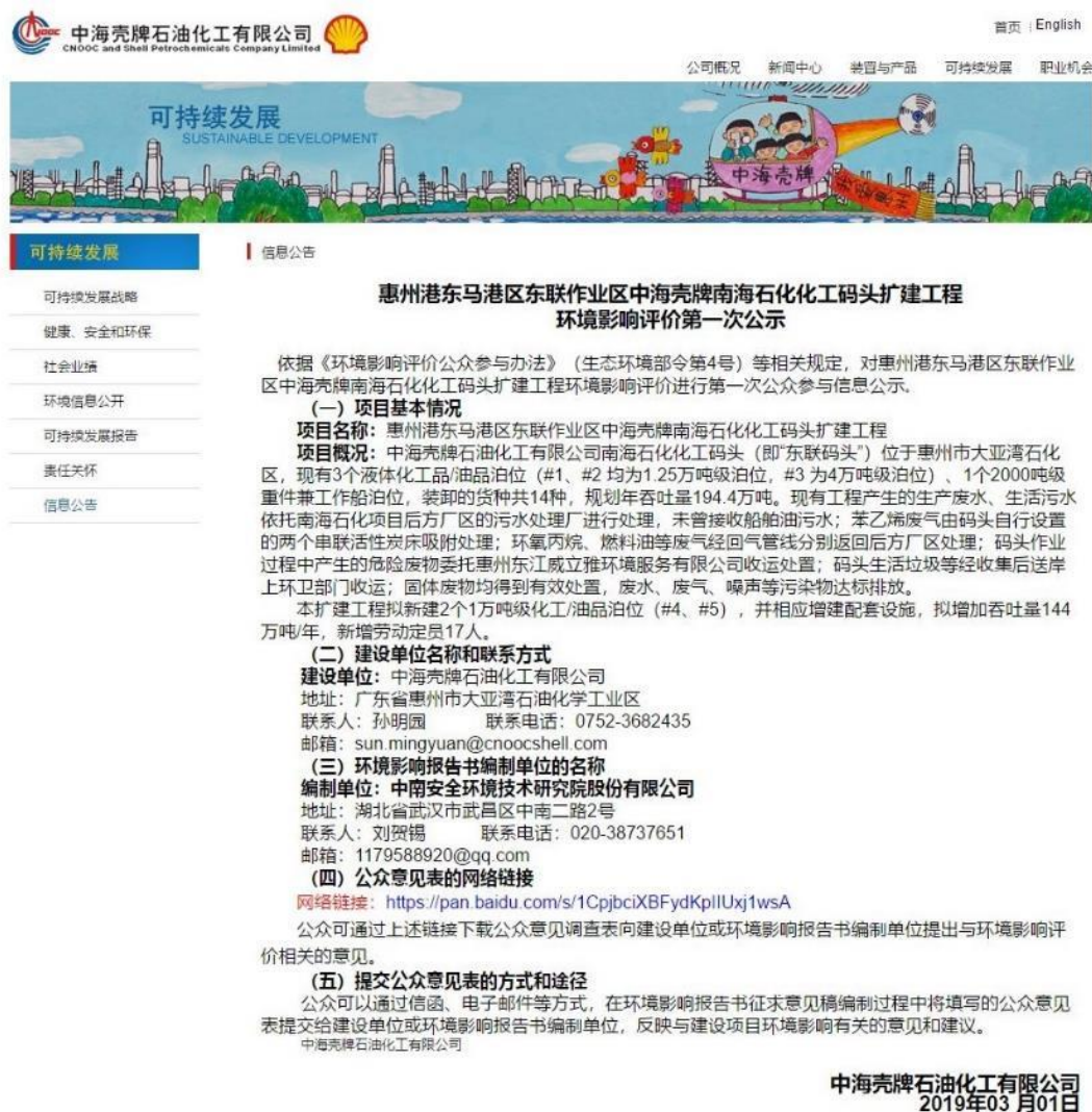
图 2.2-1 第一次网络公示截图