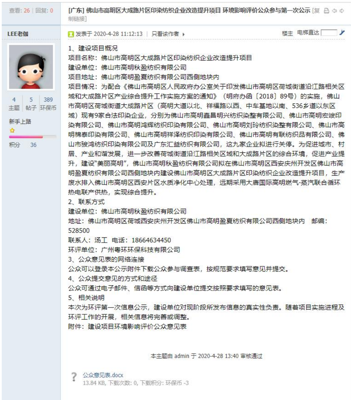
图 4.1-1 本项目首次环境影响评价信息公示