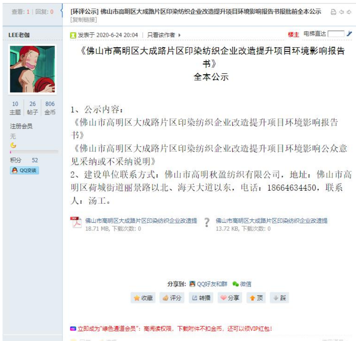
图 6.1-1 报批前网上公示截图