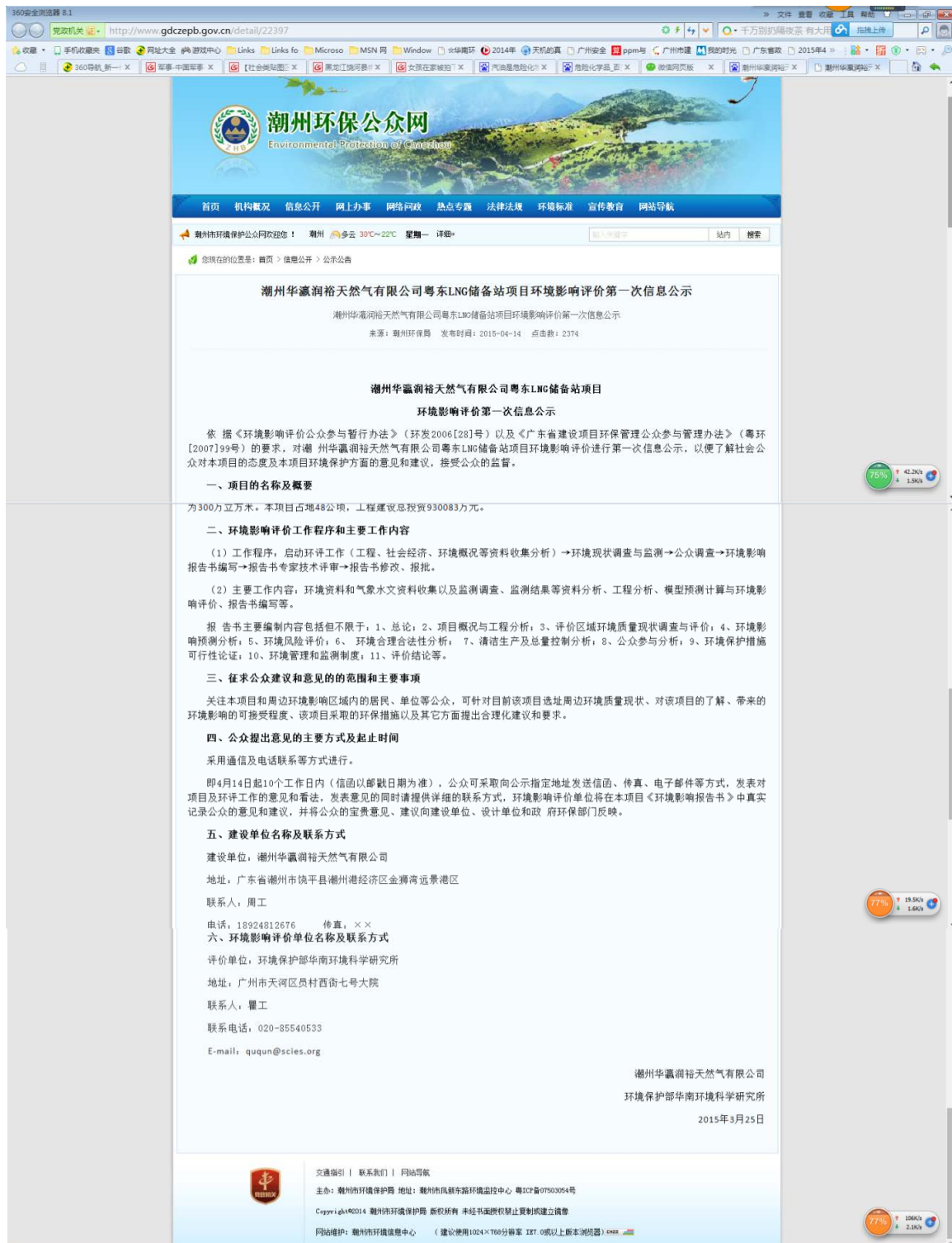
图 1.2-1 环境影响评价第一次信息公示截图

公众参与过程执行情况见表 1.3-1，本项目公众参与调查的部分照片见 1.2-3。