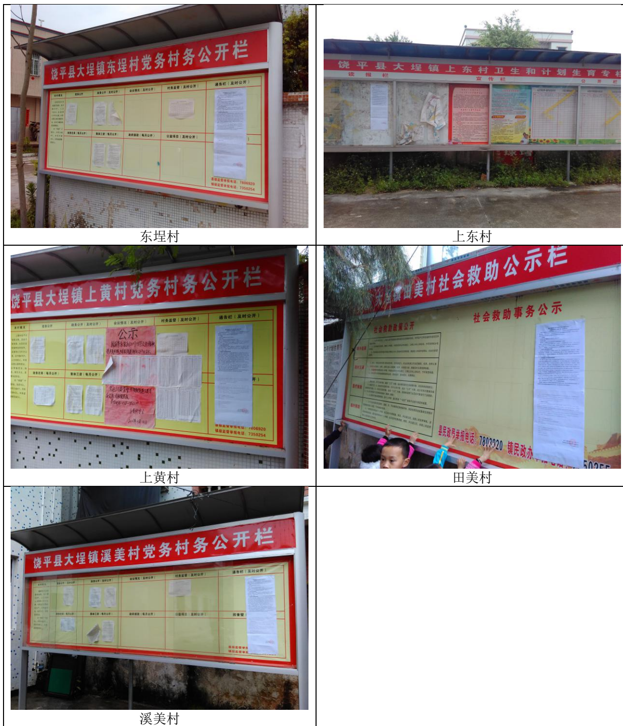
图 1.2-3 环评公示现场张贴照片